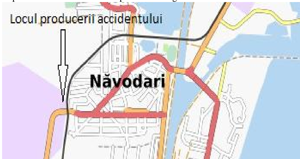
Figura nr. 1

Locul producerii accidentului este prezentat în figura nr. 1.